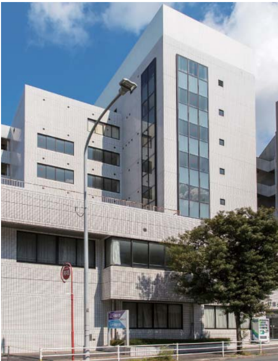
九州情報大学博多駅東サテライトキャンパス

九州情報大学博多駅東サテライトキャンパスが位置する福岡市は、九州地方の行政・経済・交通の中心地であり、同地方最大の人口(約 158 万人 2019 年 5 月現在)を有しています。東京や大阪に比べ、物価、家賃が安く、大変生活しやすいことが魅力の一つです。また、九州地方最大の駅でもある博多駅から徒歩で約 7 分という大変交通の便がよいところにあります。