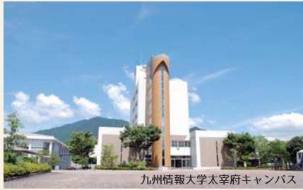
九州情報大学太宰府キャンパス

九州情報大学は、福岡県太宰府市（西鉄太宰府駅からスクールバスで5分）に1998年「経営」と「情報」の融合をめざす「経営情報学部」を有する大学として創設しました。情報処理技術を身