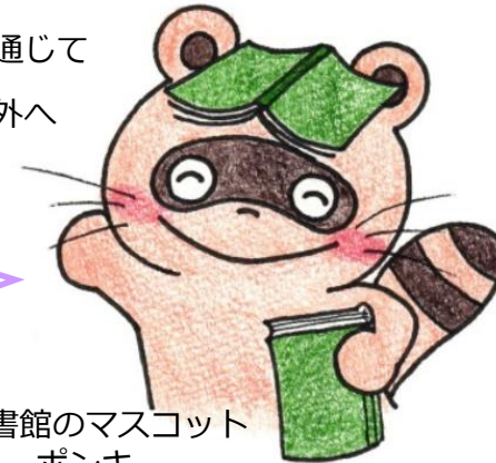
図書館のマスコット ポンキー